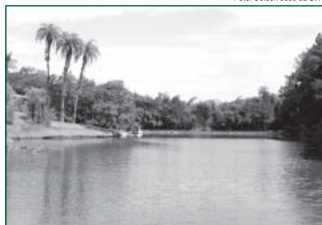
Lago do Parque Vale Verde: excursão do dia 27/02

Os lugares para a excursão a Pirapora já estão esgotados, mas o Clube de Viagem já preparou outras opções para os associados e familiares. A cidade histórica de Petrópolis é o próximo destino. O ônibus sai no dia 25 e volta no dia 27 de maio. Estão incluídos transporte, hospedagem em apartamento standard duplo, no hotel Casablanca Imperial (casablancahotel.com.br), café da manhã e três almoços. O preço é R$ 310,00, por pessoa, com visita à cidade de Itaipava. Em junho, o Clube de Viagem vai à estância hidromineral de São Lourenço, no Sul de Minas. A saída será no dia 22 e a volta no dia 24. Também está marcada o retorno a Ubatan, de águas termais, em agosto. É importante lembrar que a reserva só está confirmada com o pagamento da primeira parcela e, como as excursões estão sendo