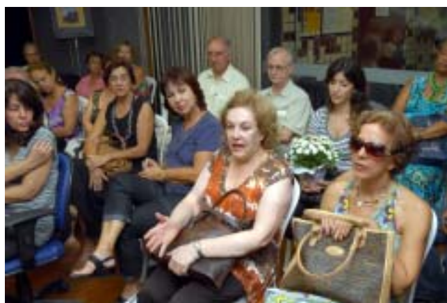
Além de prestigiar o evento, o público participou com perguntas e comentários.