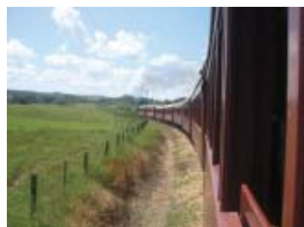
A bela paisagem vista da janela