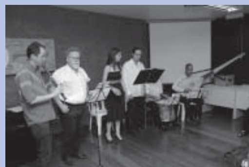
Jogral da UEMG