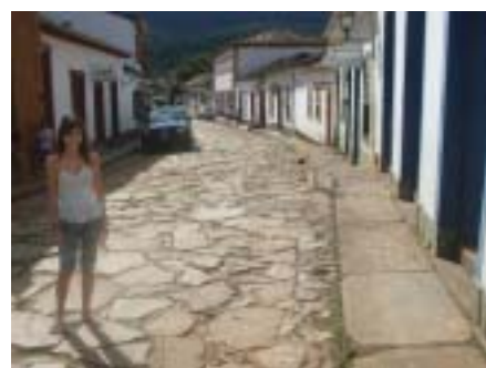
Pose para mostrar as ruas históricas