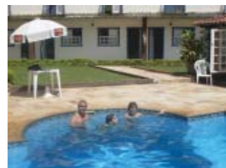
Piscina da pousada para refrescar