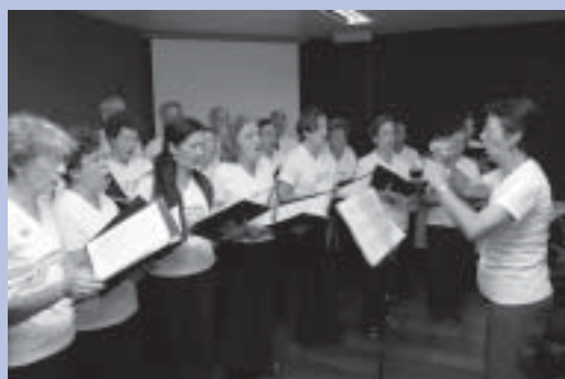
O Coral da OAP abriu os trabalhos