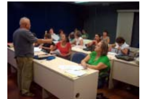
O curso começou no dia 3 de março deste ano e já tem 46 alunos.

O escrever viaja sobre o liso do papel deixando suas digitais, sinais, silêncios, enigmas que decifrados e decodificados nos levam para as maravilhas do país do faz de conta,