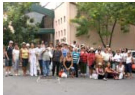
Esta é a turma que participou da excursão realizada no dia 27/02.