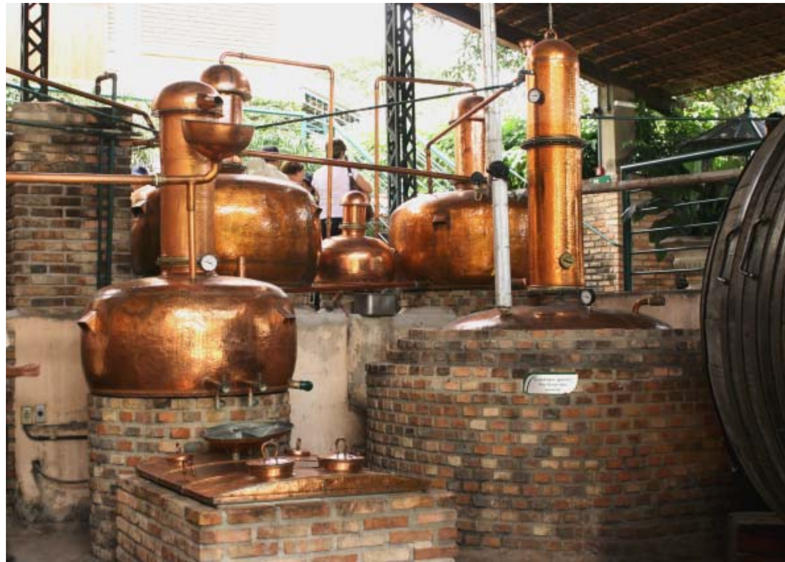
A foto feita pelo colega Celson José da Silva foi registrada na excursão do Clube de Viagem da OAP na visita ao Parque Vale Verde, em 27 de fevereiro. A primeira viagem do grupo, em 2010. Veja mais na página 8.

belas vozes fazem parte do grupo que começou a trajetória em junho de 2000. Página 4.