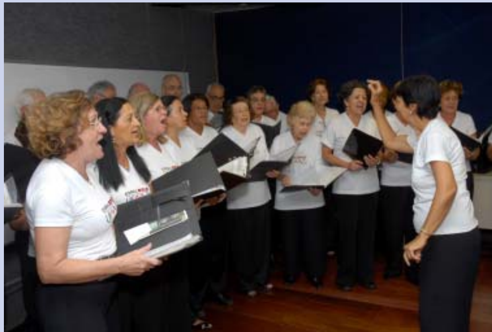
Apresentação durante a Tarde de Cultura, no dia 18 de março deste ano.