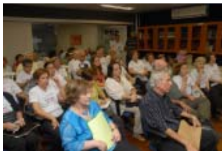
Evento sempre bastante prestigiado pelos associados da OAP e convidados.