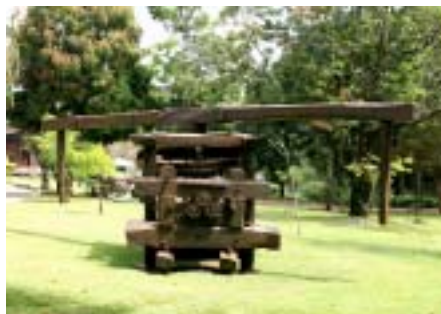
Moinho usado, antigamente, na fabricação de cachaça.